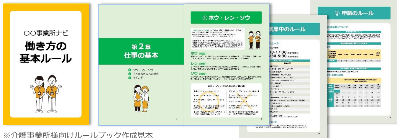
※介護事業所様向けルールブック作成見本