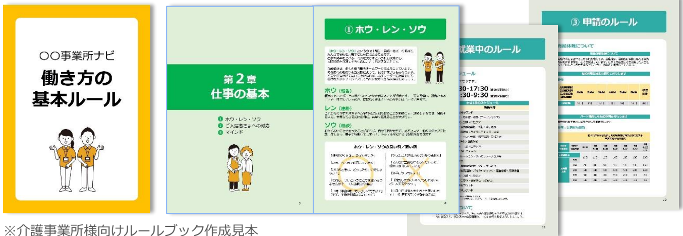
※介護事業所様向けルールブック作成見本